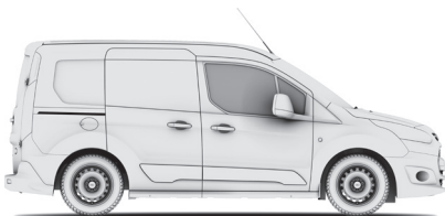
TRANSIT VAN L1